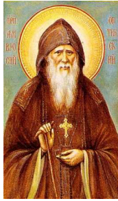
Vaga Optina Amvroosi